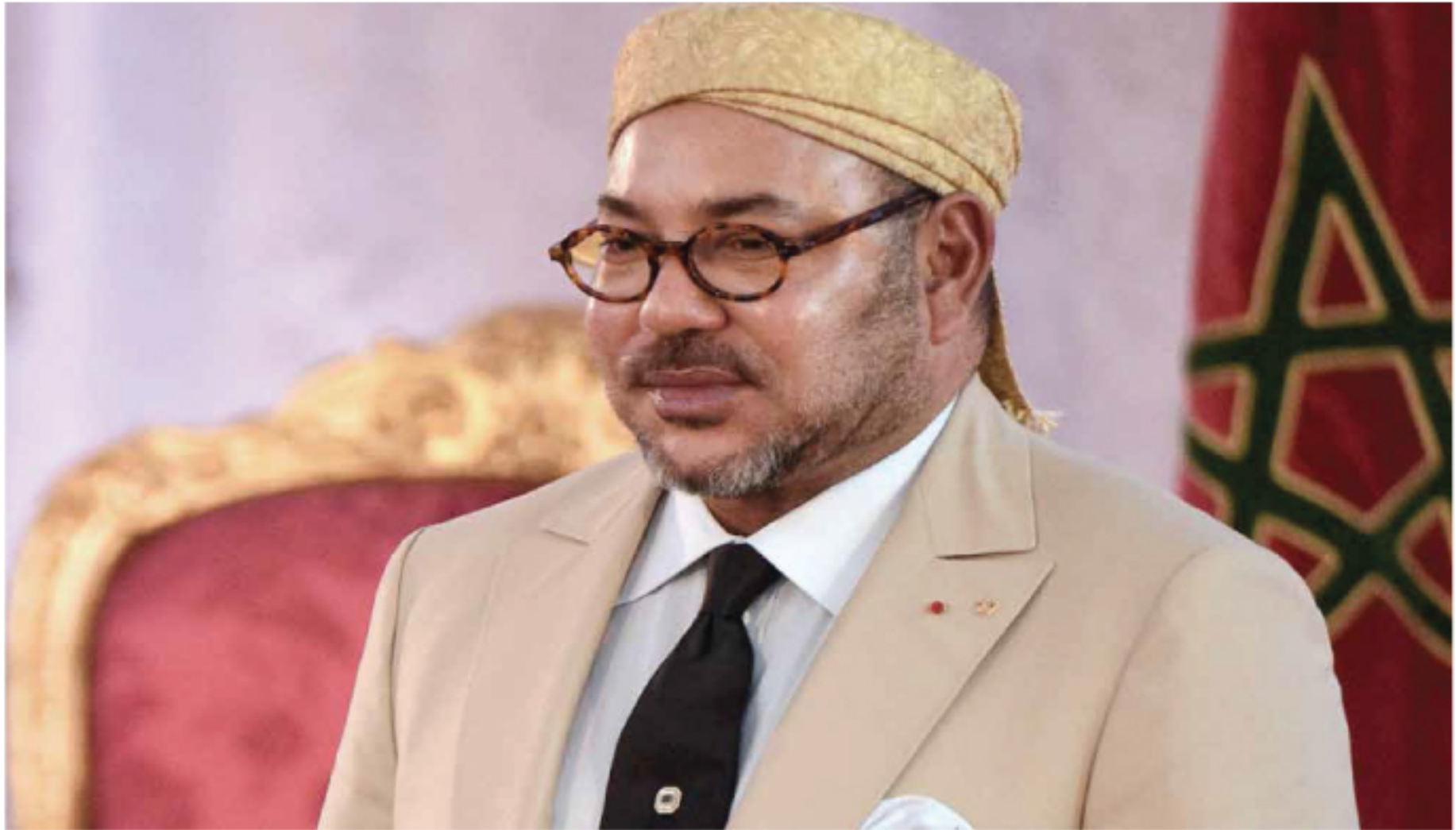
Sa Majaesté le Roi Mohammed VI Que dieu le glorifie